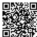
UX10 3D Demo